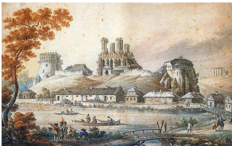
Ruine der Burg Ostrog

Ein guter Teil des umschriebenen Vierecks im Zentrum Wolhyniens gehört den Fürsten Ostrožskie . Das eigentliche Fürstentum Ostrog mit der Hauptburg und -stadt Ostrog, dem nahen Mežireč und, etwas westlich von Ostrog, dem Familienkloster Derman nimmt das südöstliche Viertel ein, nebst den südlich anstoßenden Waldgebieten der unteren Vilija und Zbytenka, nebst östlicher Fortsetzung bis Berezdovo, ja bis zum Fürstentum Zvjagol', das vorher Besitz eines selbständigen Fürstenhauses war und um 1500 an die Ostrožskie kommt.; es erstreckt sich auf beiden Ufern der Sluč'. Noch drei andere alte Fürstenresidenzen kommen an die Ostrožskie: Dubno und Rovno, endlich (seit 1509) Dorogobuž. (Nördlich, goryn'-abwärts, im Poles'e, wo nicht viel mehr als der Flußlauf besiedelt ist, haben sie die ausgedehnte Herrschaft Stepan'.) Diese letztgenannten Güter sind allerdings alles Neuerwerbungen der Wende vom 15. zum 16. Jahrhundert, der Zeit des Getmans Konstantin Ivanovič Ostrožskij.