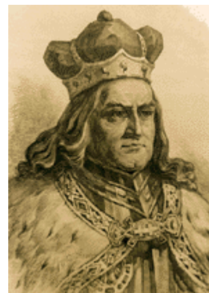
Großfürst Witold / Vytautas

Die Kette von Ereignissen, die mit dem Tode Witolds zusammenhängt, gehört der großen polnisch-litauischen, ja sogar europäischen Geschichte an; aber der große Kongreß in Luck, den Witold in seinem letzten Lebensjahr abhielt und auf dem er mit Kaiser Siegmund – unter Assistenz vieler anderer hoher Herren – über eine litauische Königskrone verhandelte, zeigt zugleich, was für eine bedeutende Rolle Wolhynien im Rahmen des litauischen Reiches spielte. Als Witold 1430 gestorben war, wurde zunächst unter voller Zustimmung Latislaus Jagellos Svidrigaila zum litauischen Großfürsten gewählt – aber gleich darauf mußte Jagello unter dem Druck seines Rates, seiner kleinpolnischen Oligarchie, seine Stellung ändern und gegen seinen Bruder zu Felde ziehen. Es war auch hier Luck, das man zum Ziel des Feldzuges wählte. Dies bedeutet nicht nur wiederum eine Anerkennung Wolhyniens und der Stadt Luck als eines der wichtigsten Zentren des litauischen Reiches, sondern es stecken hierin auch besondere kleinpolnische territoriale Erwägungen, auf die wir gleich zurückkommen werden. Der Feldzug blieb ergebnislos; außer daß er, mit ziemlicher Erbitterung und zum Teil (beidseitig) mit dem Charakter eines Konfessionskrieges geführt, den wolhynischen Eigenständigkeitswillen stärkte.