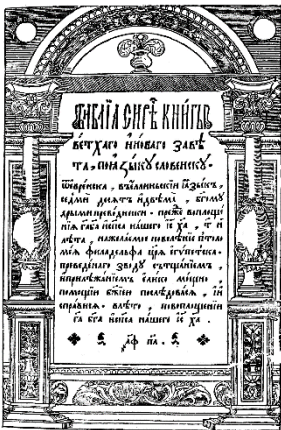
Ostrož-Bibel 1581 (Deckblatt)

Zeit ihrer Blüte bedeutende russische Gelehrte der Zeit versammelten; er ließ eine Druckerei einrichten, aus der 1581 die berühmte russische "Ostrožskijbibel" hervorging. In den Kirchenkämpfen der 90er Jahre um die Brester Union spielte er eine bedeutende Rolle als Gegner der Union, allerdings gemäßigter Haltung, weshalb er das Vertrauen nicht nur des Patriarchen, sondern auch des Königs genoß. Aber die schwere Krise, welche die Wende zum 17. Jahrhundert für das orthodoxe Bekenntnis wie für die russische Sprache in Südwestrußland bedeutete, traf auch das Haus Ostrožskij: sein Sohn Janusz wurde Katholik – in der ersten Hälfte des 17. Jahrhunderts starb die Familie aus.