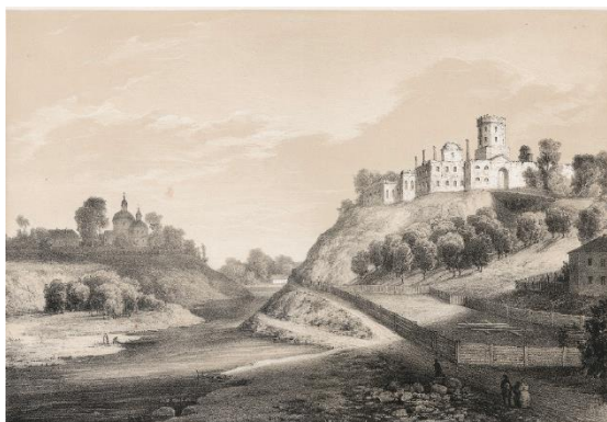
Korec (Napoleon Orda)

Ladislau III. und Kasimir der Jagellone. Der bedeutendste Gol'sanskij der folgenden Generation war Jurij Semenovič, der den Wirt machte zu jener bedeutenden Magnatenkonferenz in Holzszany 1440 nach Sigmund Kejstutovičs Ermordung, auf der er mit Jan Gasztold und einigen anderen Oligarchen das Schicksal Litauens entschied. Die Gol'sanskie waren vollkommen zu Russen geworden und gut orthodox, so daß einer sogar mit dem um den Kiewer Fürstenthron gebrachten Michail Olel'kovič zusammen 1481 jene "partikularistische" Verschwörung anzettelte, um derentwillen sie ihr Haupt auf den Block legen mußten – während sein Bruder Semen Jur'evič noch nachher als Starosta von Luck und einer der wichtigsten Mitkämpfer des Konstantin Ivanovič Ostrožskij gegen die Tataren eine positivere Ausdrucksform des Russentums fand.