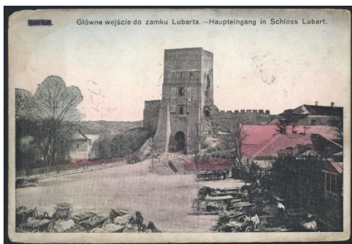
Lubart-Burg in Luck

Der alles überwiegende Einfluß, den die hiesige Aristokratie (deren bedeutendste Glieder wir später noch charakterisieren werden) im Lande hat, wirkt sich auch auf den Charakter des Städtelebens aus: in Wolhynien gibt es nur ganz wenige Städte (die landesherrlichen) mit bedeutenderem inneren Leben, dagegen eine große Zahl kleiner Magnatenstädtchen mit schwacher Selbstverwaltung. In Galizien haben wir auch eine starke Magnatenschicht gefunden, aber es rettete sich doch als Gegengewicht in die Neuzeit ein bedeutender Kronbesitz, in Form einer ganzen Anzahl von Starosteien verwaltet, und ungefähr jeder Starostenhauptstadt entsprach eine bedeutendere Stadt. In Wolhynien war der landesherrliche Besitz schon