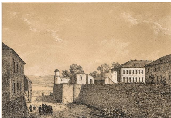
Schloß Dubno (Napoleon Orda)

Diesem Tatbestand entspricht nun eben das Bild einer großen Anzahl von Kleinstädten unter dem Schirme ihrer Magnaten, die miteinander eine Art Wirtschaftskleinkrieg führen, mit willkürlicher Errichtung von Zöllen und Märkten und dergleichen. Zwar die meisten dieser Städtchen wurden erst im 16. Jahrhundert mit